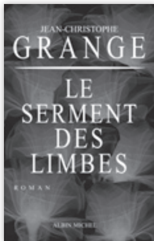
Le thriller de l'été.

Depuis, j'ai salué d'un reportage tous ses livres et le succès qu'il a connu n'a jamais démenti mon engouement. Violents, ses polars, mais tellement bien ficelés, qu'on n'a qu'une envie : aller au bout pour résoudre l'énigme.