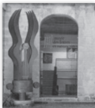
Le musée des lettres et manuscrits.

Voici enfin l'exposition sur le Titanic. Il faut passer quelques vitrines générales avant d'arriver à l'essentiel de l'exposition : le manuscrit d'Helen Churchill Candee, qui raconte l'épopée depuis le départ du navire de Southampton jusqu'au naufrage. C'est ce manuscrit qui a servi à James Cameron pour faire son film avec Leonardo di Caprio et Kate Winsley. Le texte traduit en français est bouleversant et montre à la fois la grandeur du capitaine Edward John Smith, qui commandait le bateau, des musiciens du bord, de certains passagers et la scélératesse de certains autres, comme le directeur de la compagnie Withe Starline à qui appartenait le Titanic. La reconstitution d'une cabine, les images de ce navire d'un luxe inouï accompagnent le texte d'Helen Churchill Candee. À côté, un menu daté du 12 Avril 1912, alors que le bateau a coulé dans la nuit du 14 au 15, faisant 1726 morts, dont 22 Français