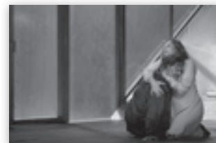
La Walkyrie, sous la direction de sir Simon Ratle.