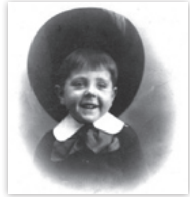
Jacques Prévert vers 1904.